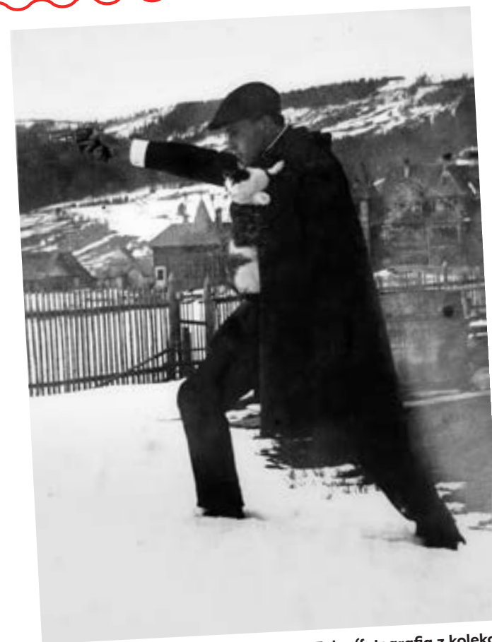
Stanisław Ignacy Witkiewicz z kotką Foką

Matka nie jest „o czymś”, nie opowiada o życiu w XIX czy XXI wieku, w Polsce ani gdziekolwiek indziej. Dzieło sztuki czystej według Witkacego jest bytem niezależnym od wszelkich innych światów. Dramat rozgrywa się we własnej rzeczywistości, sam w sobie i tylko ze sobą jest tożsamy. Z tekstu sztuki nie ma sensu wyciągać wniosków o relacjach rodzinnych jej autora. Leon nie