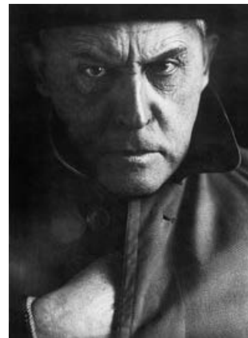
Stanisław Ignacy Witkiewicz, „Autoportret”, około 1938 r.

Leon jest przekonany, że jako „jedyń w swoim rodzaju osobnik” zna recepty na szczęście ludzkości. Taką postawę prezentował też ojciec Witkacego – w listach, artykułach i książkach pouczał prawie wszystkich: warszawiaków i krakowian, Jana Matejkę, Wojciecha Gersona, członków Zachęty, jurorów w konkursach artystycznych i lekarzy uzdrowiskowych.