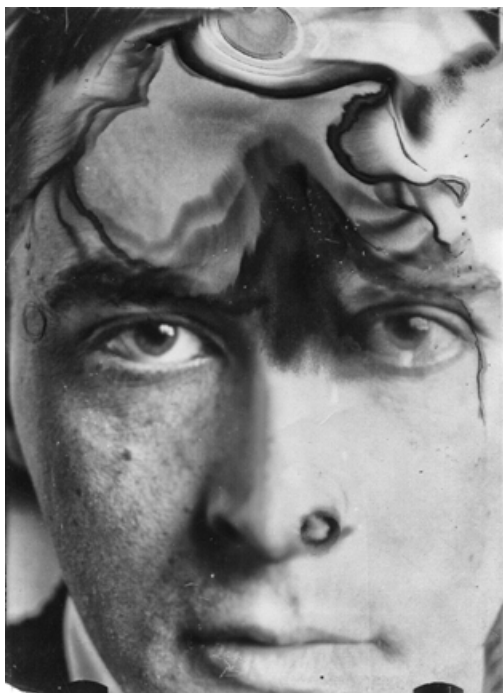
Stanisław Ignacy Witkiewicz, „Autoportret”, 1912