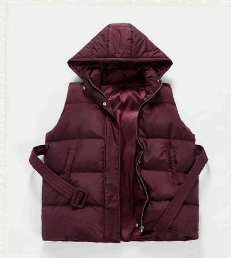
Zimowa klasyka: kurtka puffer