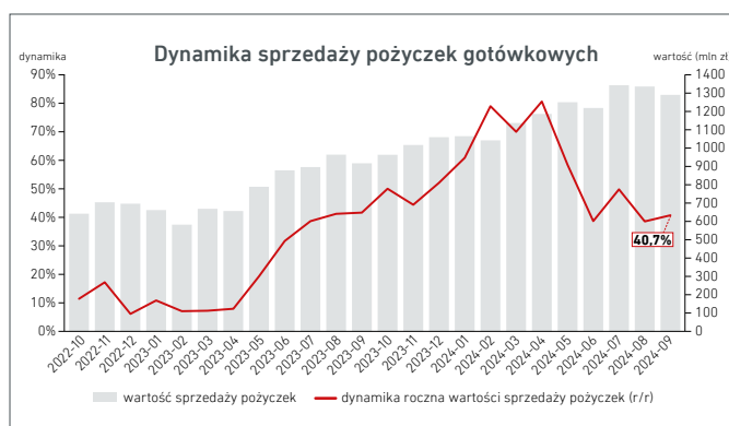
Wartość i dynamika roczna (miesiąc do miesiąca roku poprzedniego)

Drugim segmentem są pożyczki gotówkowe , które wypłacane są bezpośrednio na konto klienta i mogą być wykorzystywane na dowolny cel, w tym podreperowanie budżetu domowego. Cechą charakterystyczną pożyczek gotówkowych jest ich wyższa szkodowość w porównaniu do pożyczek celowych. W segmencie tym można wyróżnić dwie kategorie pożyczek gotówkowych. Pożyczki gotówkowe udzielane na niskie kwoty i krótkie okresy – tzw. „chwilówki” oraz na wysokie kwoty i długie, często kilkuletnie okresy. Ten drugi typ pożyczek podobny jest do bankowych kredytów gotówkowych. Średnia wartość pożyczki gotówkowej udzielonej w we wrześniu 2024 r. wyniosła 2 661 zł