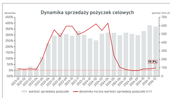
Wartość i dynamika roczna (miesiąc do miesiąca roku poprzedniego)

Drugim są pożyczki gotówkowe , które wypłacane są bezpośrednio na konto klienta i mogą być wykorzystywane na dowolny cel w tym podreperowanie budżetu domowego. Cechą charakterystyczną pożyczek gotówkowych jest ich wyższa szkodowość w porównaniu do pożyczek celowych i są one udzielane również na wyższe kwoty. W segmencie tym można wyróżnić bowiem dwie kategorie pożyczek gotówkowych. Pożyczki gotówkowe udzielane na niskie kwoty i krótkie okresy – tzw. „chwilówki” oraz na wysokie kwoty i długie, często kilkuletnie