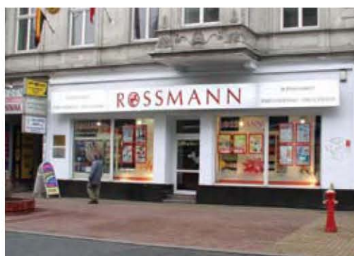
Pierwszy sklep Rossmann w Polsce (Łódź, 1993)

Przynależność do międzynarodowej grupy kapitałowo-zakupowej daje nam silną pozycję nie tylko na polskim i europejskim rynku, ale pozwala także odważnie patrzeć na konkurencję w perspektywie światowej gospodarki. To szczególnie ważne w obliczu nieuchronnych procesów globalizacyjnych i ciągłej ekspansji sieci handlowych.