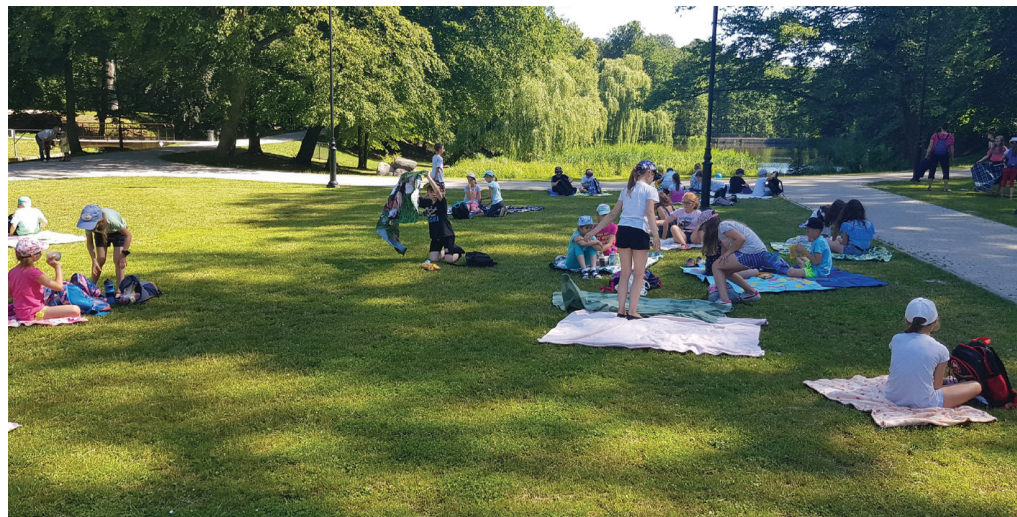
Półkolonie organizowane przez Szkołę Podstawową nr 86 w Gdańsku