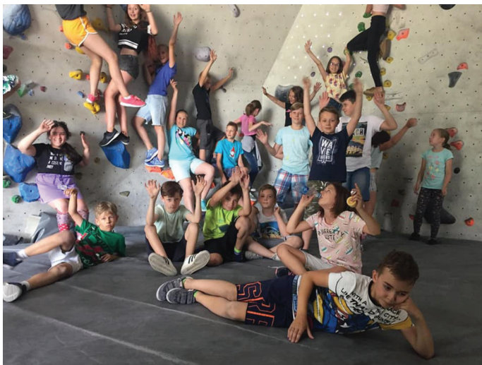
Półkolonie organizowane przez Szkołę Podstawową nr 8 w Gdańsku