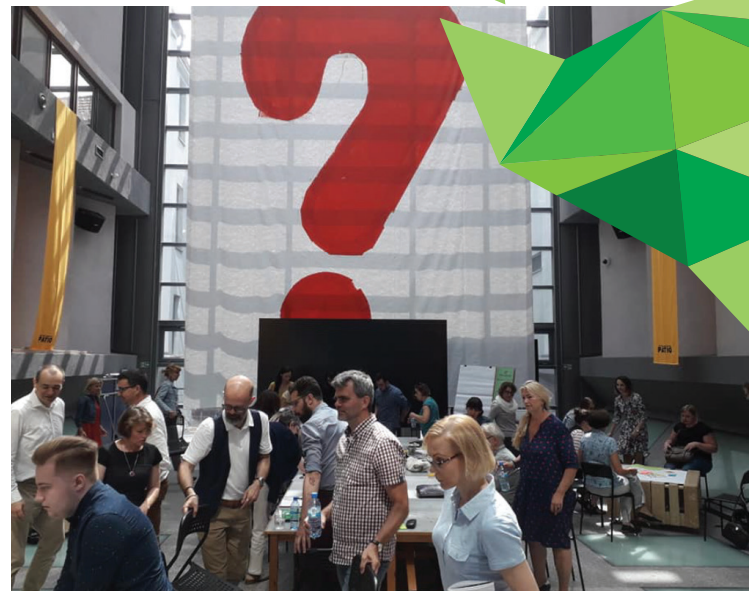
Gdańskie Forum Edukacyjne