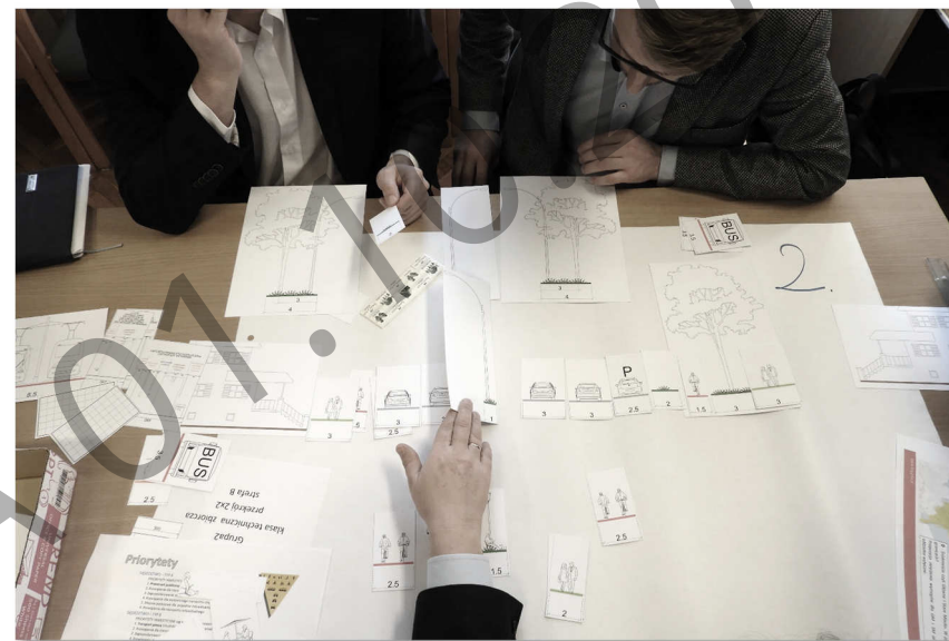
fot. 1. Praca nad doborem elementów ulicy – warsztaty w dniu 15.12.2017.

Gdańskich przykładów. Jednocześnie zadania warsztatowe stanowiły ułatwienie w dyskusji nad przedstawionymi w części pierwszej założeniami.