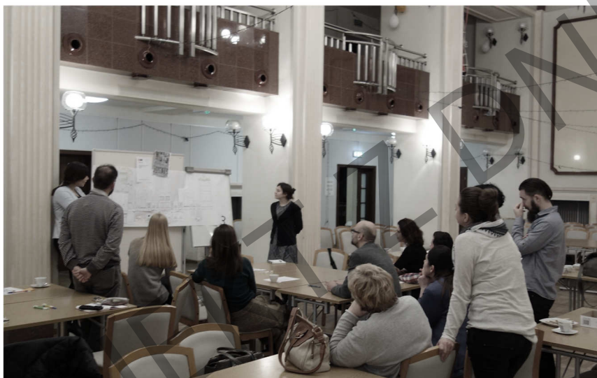
fot. 6. Warsztaty skierowane do organizacji pozarządowych – prezentacja efektów.