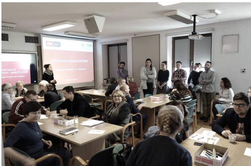
fot. 2. Warsztaty dla specjalistów z jednostek miejskich i wydziałów urzędu miejskiego