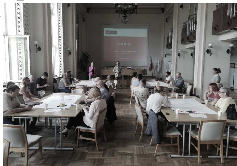
fot. 8. Warsztaty 05.09.2019 r. - prezentacja wstępna