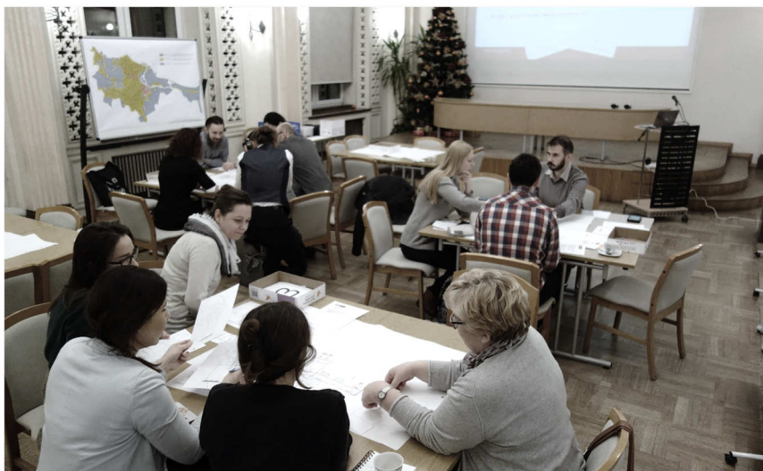
fot. 5. Warsztaty skierowane do organizacji pozarządowych – praca w grupach