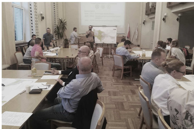
fot. 9. Warsztaty 05.09.2019 r. - prezentacja wyników

Warsztaty zostały zrelacjonowane i skomentowane w artykule, który ukazał się na portalu internetowym trojmiasto.pl https://www.trojmiasto.pl/wiadomosci/jak-beda-projektowane-ulice-w-Gdanskun137782.html