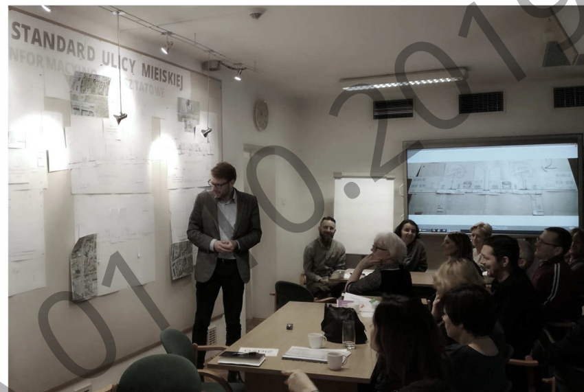
fot. 3. Warsztaty dla specjalistów z jednostek miejskich i wydziałów urzędu miejskiego – prezentacja efektów.

Na spotkaniu dla specjalistów z jednostek miejskich przedyskutowano dodatkowo możliwości tyczenia korytarzy infrastruktury poza ulicami. Większość zebranych wskazywała jednak złożony problem możliwej realizacji takiego pomysłu, a przede wszystkim skomplikowany i kosztowny proces przejmowania gruntów na takie cele. Uczestnicy dyskusji uznali za znacznie lepsze rozwiązanie - realizację kanałów infrastruktury w ramach pasów drogowych, chociaż przedstawiciele poszczególnych gestorów sieci zastrzegali, że nie byli przekonani czy konkretnie ich sieci powinny być w takich kanałach prowadzone.