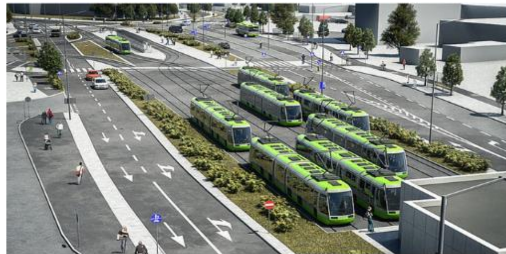
Budowa zintegrowanego Centrum Przesiadkowego przy dworcu PKS