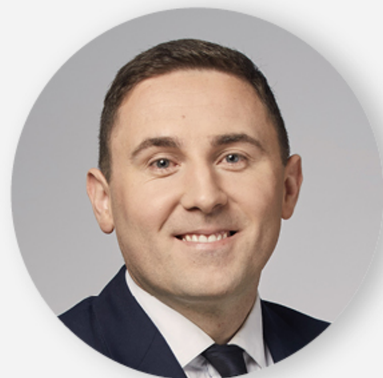
Piotr Borawski z-ca prezydenta ds. przedsiębiorczości i ochrony klimatu