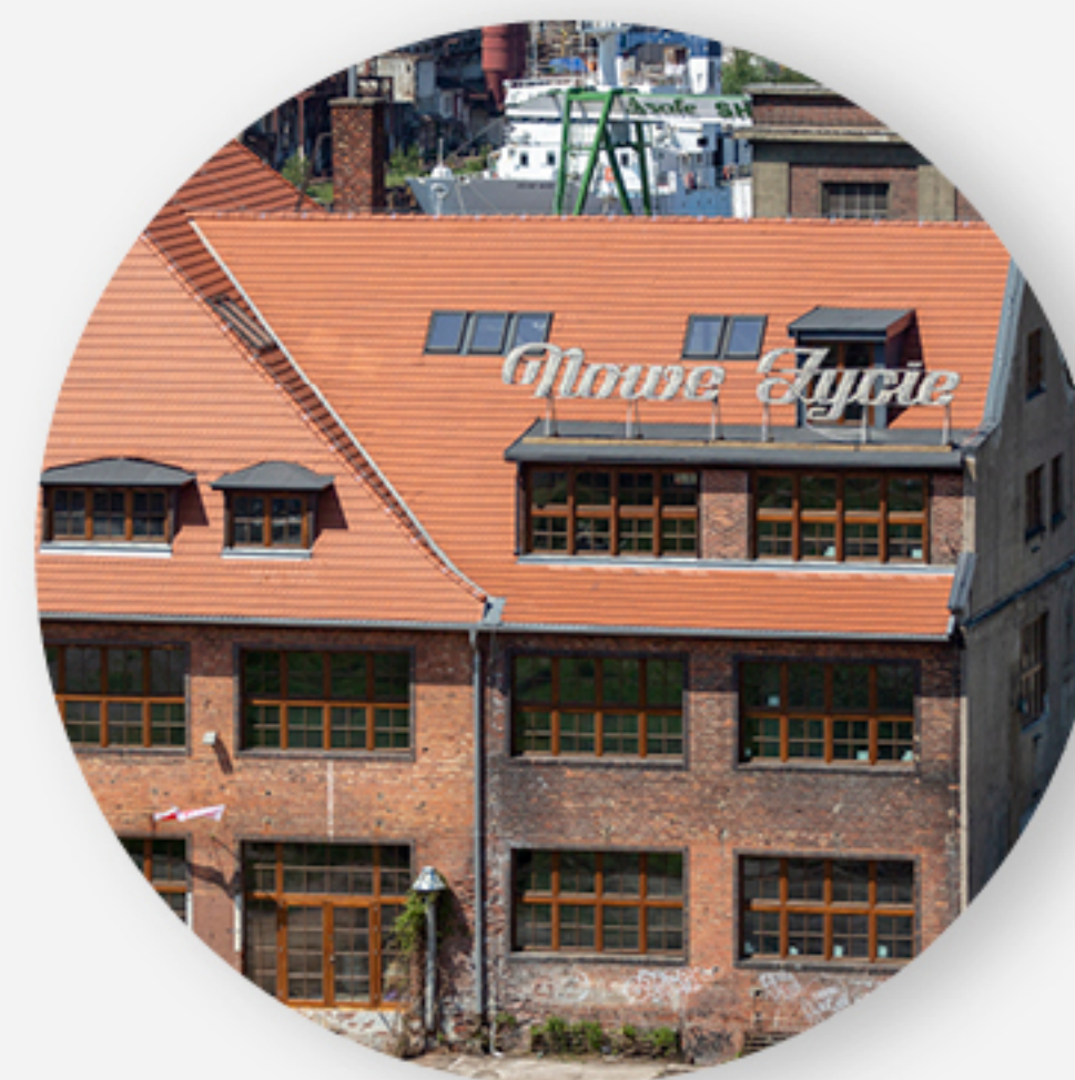
Muzeum Sztuki Współczesnej NOMUS (2021)