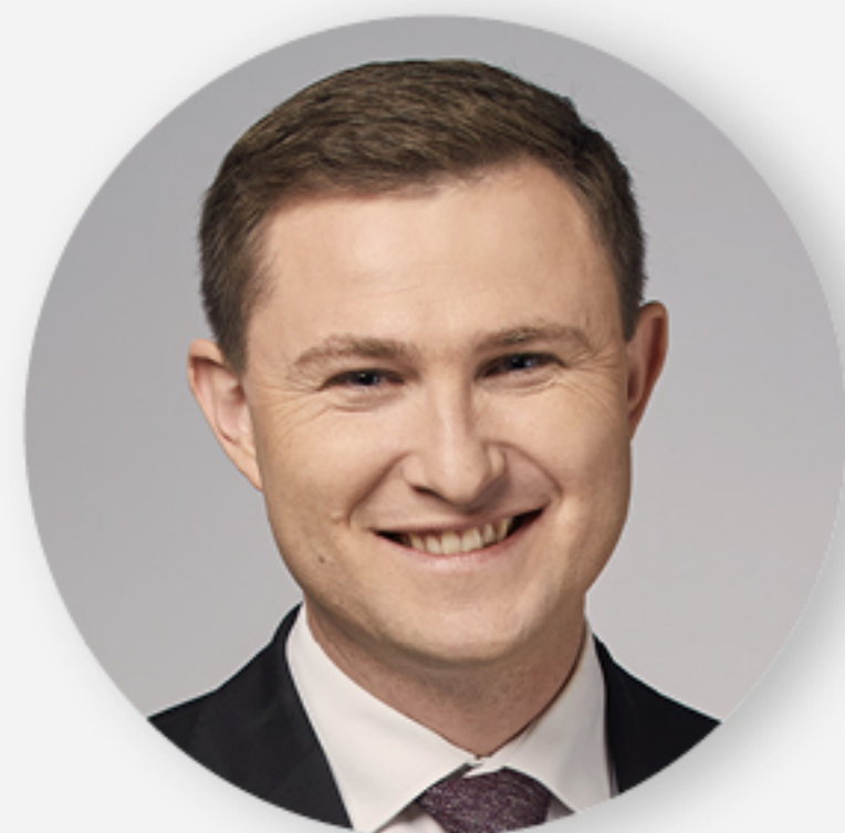
Piotr Grzelak z-ca prezydenta ds. zrównoważonego rozwoju i mieszkalnictwa