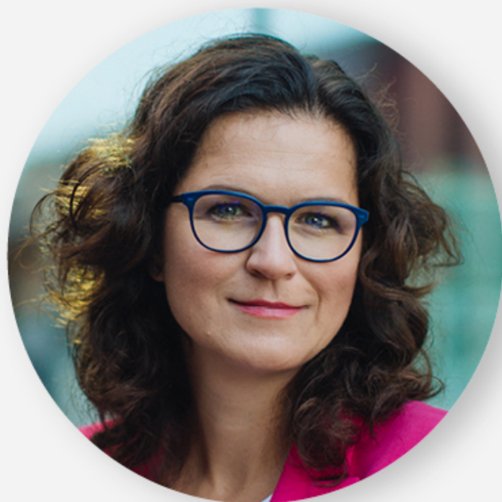
Aleksandra Dulkiewicz prezydent Gdańska