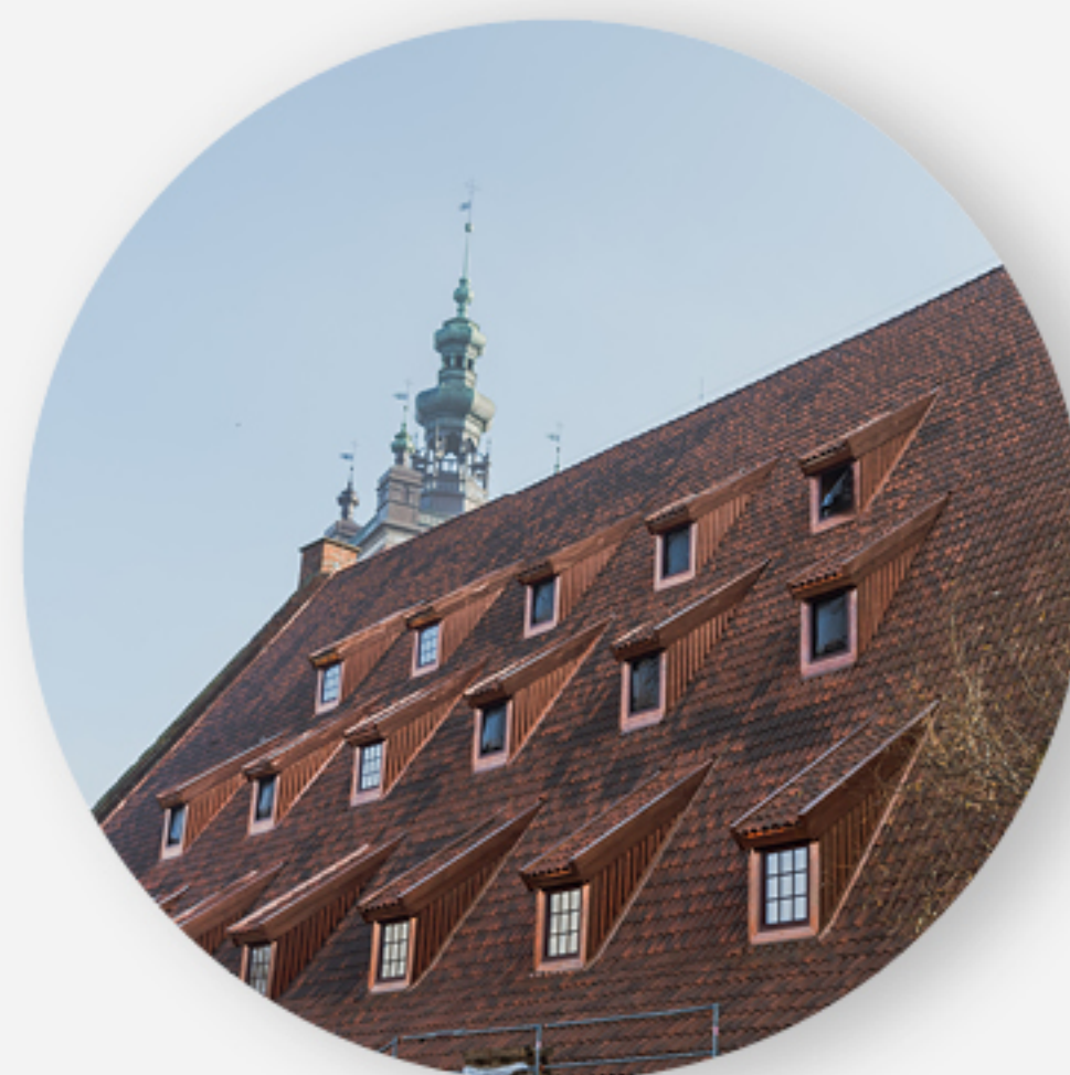
Muzeum Bursztynu w Wielkim Młynie (czerwiec 2021)