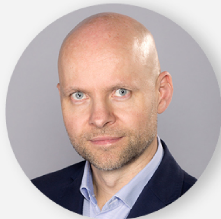
Alan Aleksandrowicz z-ca prezydenta ds. inwestycji