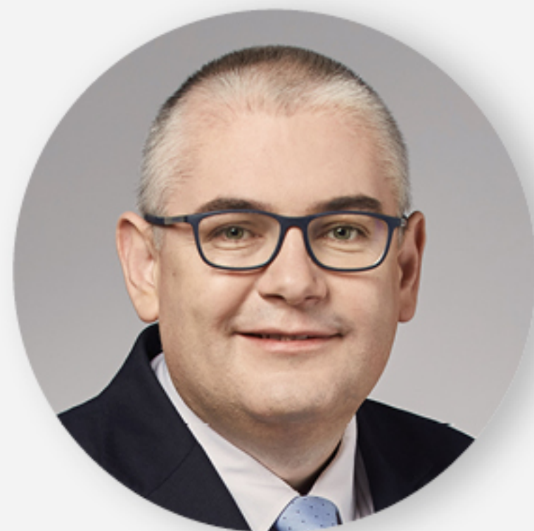
Piotr Kowalczyk z-ca prezydenta ds. edukacji i usług społecznych