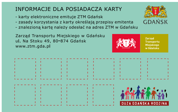
Karta Dużej Gdańskiej Rodziny

– W związku z tym, posiadacze Kart Dużej Gdańskiej Rodziny, na których nie ma już miejsca na naklejenie hologramu na