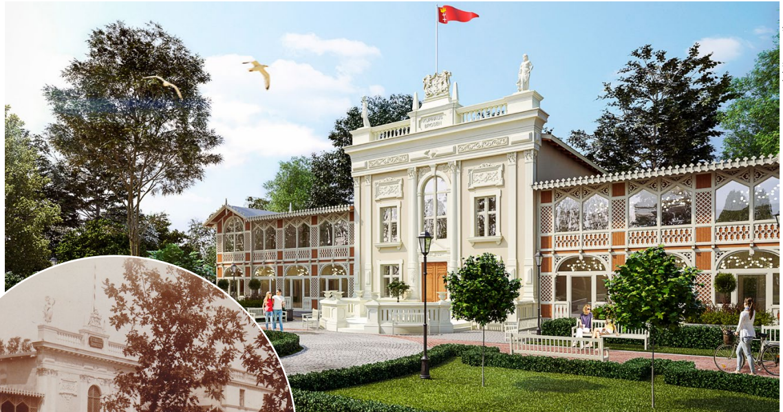
Wizualizacja Domu Zdrojowego w Brzeźnie

Brzeźno reklamowano jako „idyllicznie położone” i „gwarantujące spokój” kąpielisko. Jego sercem był Dom Zdrojowy i położona obok, oddana około 1899 roku, Hala Plażowa. W tym samym czasie zbudowano molo (wkrótce przedłużone), łazienki na plaży i skrzydło