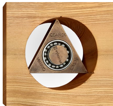
Medal za wspólny bilet na komunikację miejską

Szczególne wyróżnienie Pomorskich Sztormów – Medal Karty Trójmiasta – przyznawane jest od 2007 roku inicjatywom i osobom przyczyniającym się do integracji i zrównoważonego rozwoju naszej metropolii.