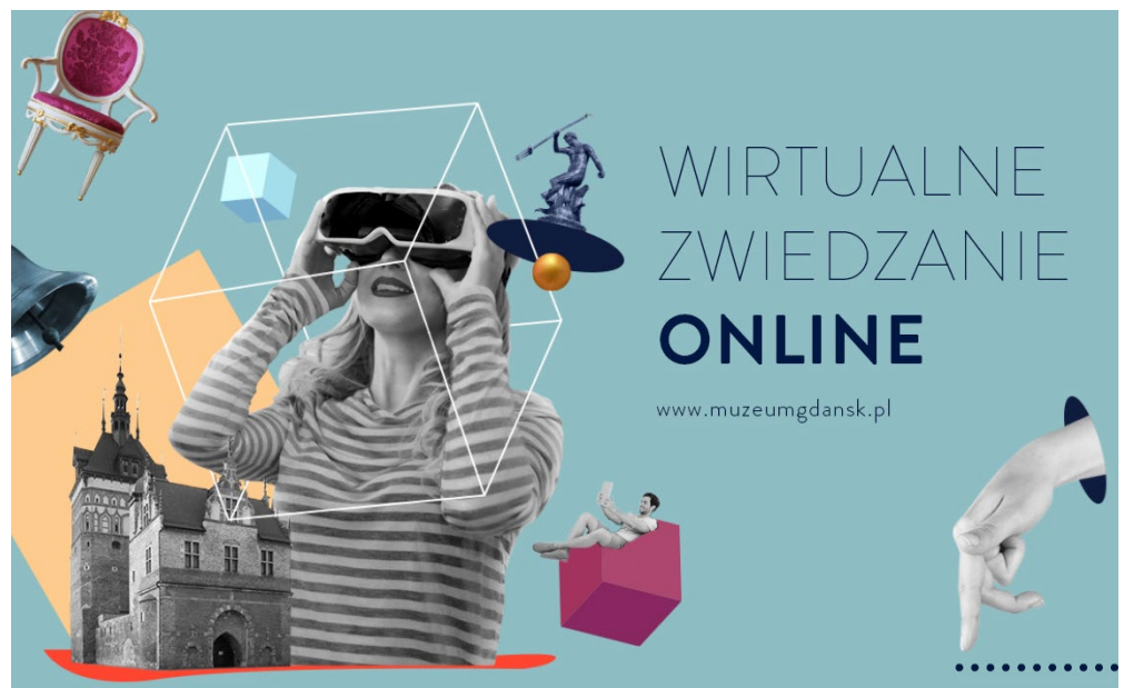
Muzeum Gdańska oferuje wirtualne zwiedzanie dziewięciu swoich oddziałów

W ramach działań on-line jakie prowadzi Centrum Sztuki Współczesnej Łaźnia można posłuchać podcastów poświęconych sztuce współczesnej ARTCAST. Emitowane są w ostatnią sobotę miesiąca na antenie internetowej stacji Radio Kapitał, a po emisji można je odsłuchać także na kanale Spotify instytucji. Nie brakuje też oferty dla najmłodszych: Łaźnia wypuściła dwa audiobooki e-opowieści Łaźniaka, w których edukacyjny bohater instytucji Łaźniak wprowadza najmłodszych adeptów kultury w tajniki działania instytucji i sztukę współczesną. Audiobooki można odsłuchać i pobrać ze strony www.laznia.pl .