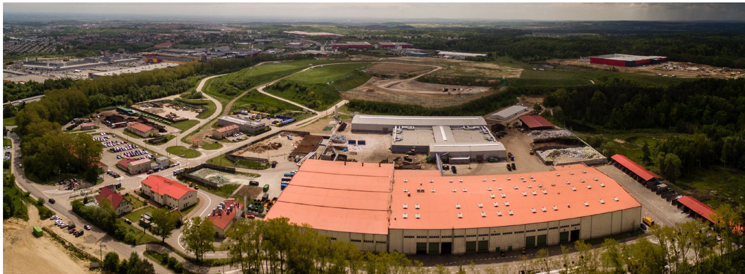
Teren Zakładu Utylizacyjnego zajmuje prawie 72 hektarów

OSTATNIM TYGODNIOM LATA I POCZĄTKOWI JESIENI TOWARZYSZYŁA WZMOŻONA ODCZUWALNOŚĆ ZAPACHÓW Z TERENU ZAKŁADU NA SZADÓŁKACH. MIAŁO NA TO WPŁYW KILKA CZYNNIKÓW.