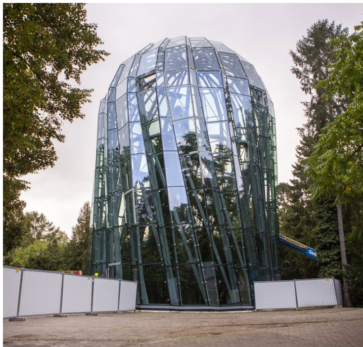
Szklana rotunda palmiarni to piękny, ale bardzo skomplikowany projekt architektoniczny

Kompleks palmiarni w Parku Oliwskim składa się z 4 budynków: rotundy, oranżerii, budynku socjalno-technicznego i szklarni. Budowa budynku socjalnego już się zakończyła, w rotundzie na ukończeniu jest szklenie obiektu, a przebudowa oranżerii jest na etapie prac rozbiórkowych. Rewitalizacja zabytkowych parkowych budynków, oprócz zabezpieczenia obiektów przed degradacją, poprawą stanu technicznego, ma na celu wyeksponowanie wartości kulturowych historycznego Parku Opackiego.