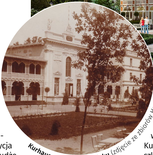
Kurhaus, początek XX wieku

hotelowe Domu Zdrojowego. Kurhaus oferował 25 pokoi dla letników, w części urządzono większe pokoje dla rodzin wyposażone w kuchenki i balkony. Chlubą była duża sala koncertowa mieszcząca 400-500 osób.