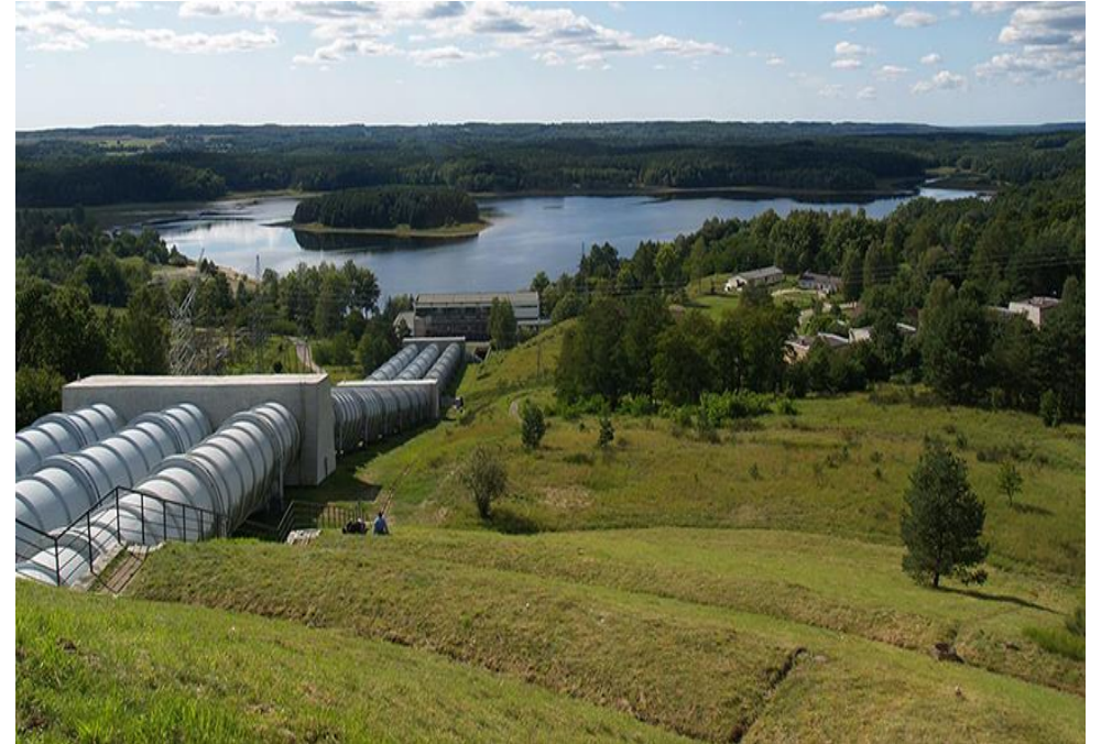
Elektrownia szczytowo – pompowa w Żydowie