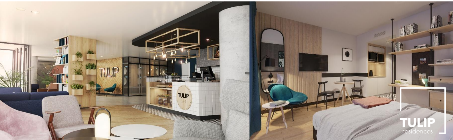
Tulip Residences Joinville-le-Pont, Frankreich. Geplante Eröffnung: März 2021.