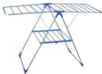
Suszarka na bieliznę