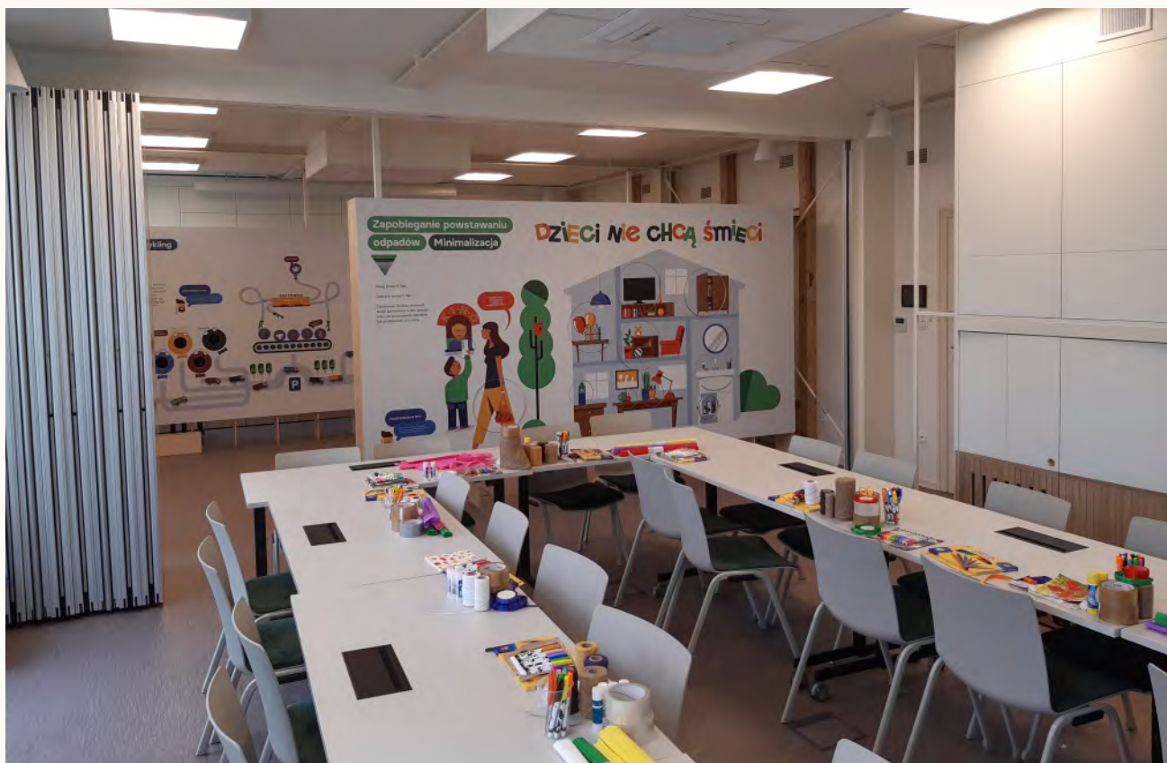
Pracownia edukacji ekologicznej w Domu Zdrowym w Brzeźnie

Wie, że należy postępować w taki sposób, aby na składowisko trafiło jak najmniej odpadów.