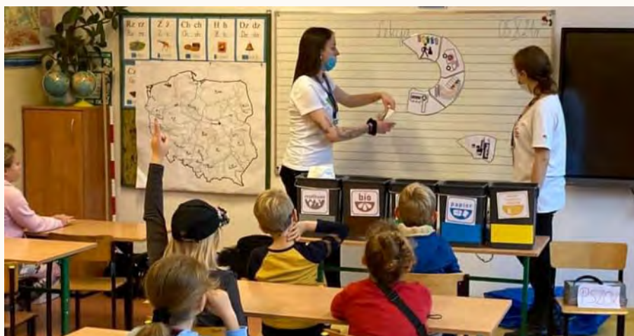
Lekcja w kl. II „EDUKACJA-SEGREGACJA!”

Wie na poziomie ogólnym jak odpady i zanieczyszczenia nimi, zagrażają środowisku i ludzkości.