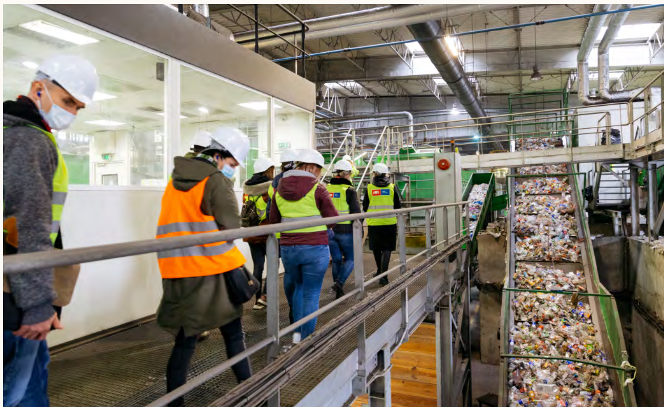
Zakład Utylizacyjny w Gdańsku – sortownia odpadów komunalnych