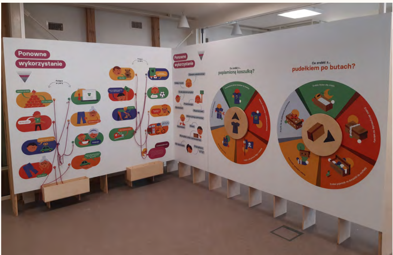
Pracownia edukacji ekologicznej w Domu Zdrowym w Brzeźnie

założeniem prowadzonych dla tych klas warsztatów jest odpowiedzialne podejście do konsumenckich wyborów, które wpływają na ilości wytwarzanych odpadów. Podstawą scenariuszy lekcji jest tutaj tzw. piramida odpadowa, zgodnie z którą uczniowie poznają proste zasady i nawyki prowadzące do wytwarzania znacznie mniejszych ilości odpadów, jak np. korzystanie z przedmiotów wielorazowego użytku, wymiana rzeczy niepotrzebnych czy naprawianie zamiast kupowania nowych.