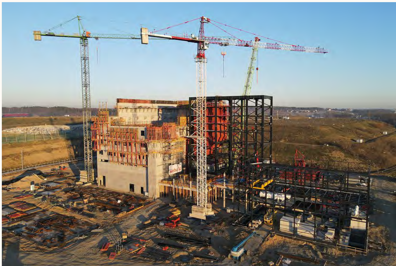
Port Czystej Energii – budowa zakładu odzysku energii z odpadów