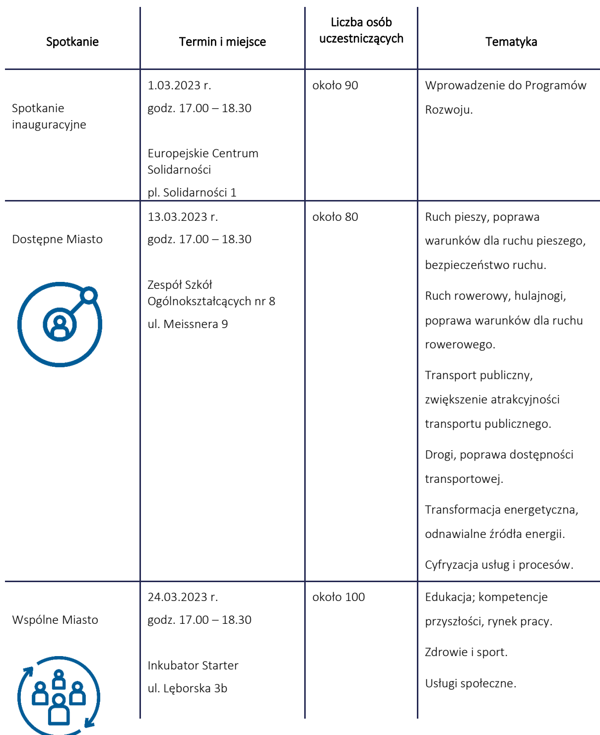
Tab. 1. Informacje organizacyjne dotyczące spotkań wokół Programów Rozwoju

W kolejnych tygodniach marca i kwietnia odbyły się cztery spotkania warsztatowe, podczas których mieszkanki i mieszkańcy Gdańska oraz pozostałe osoby zainteresowane miały okazję szczegółowo podyskutować o Programach Rozwoju. Każde ze spotkań warsztatowych poświęcone było innemu Programowi Rozwoju i przebiegało według tego samego schematu, co zapewniło spójność wypracowanych wyników.