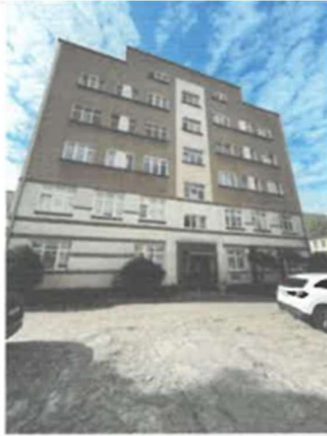
Widok na wejście do budynku i od budynek od strony północnej