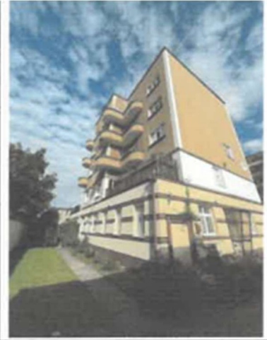
Widok na budynek do strony wschodnio-południowej

Gdynia ul 3 Maja 14A/6, Województwo Pomorskie Dzielnica Śródmieście