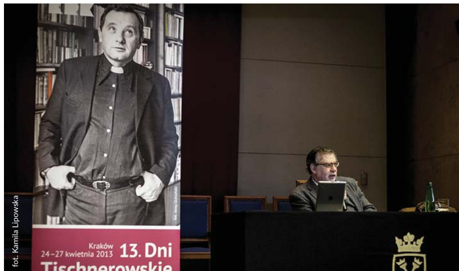
Colloquia Tischneriana prof. Joseph Weiler

Pawilon Wyspiańskiego, Pl. Wszystkich Świętych 2 | InfoKraków, ul. Św. Jana 2