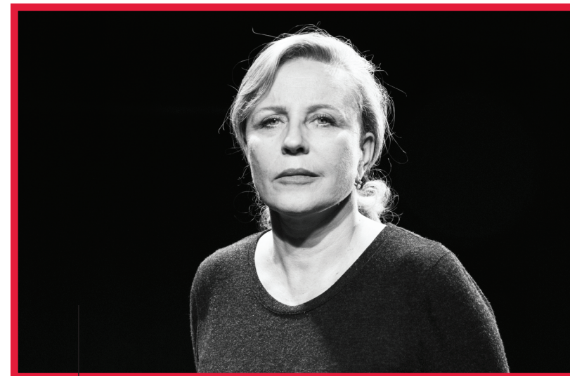
Krystyna Janda

Reżyser spektaklu Tacy duzi chłopcy na podstawie tekstów Jana Wołka (koprodukcja warszawskiego Och-Teatru oraz częstochowskiego teatru im. A. Mickiewicza). Za zasługi dla kultury odznaczony m.in. Srebrnym Medalem Zasłużony Kulturze Gloria Artis (2005).