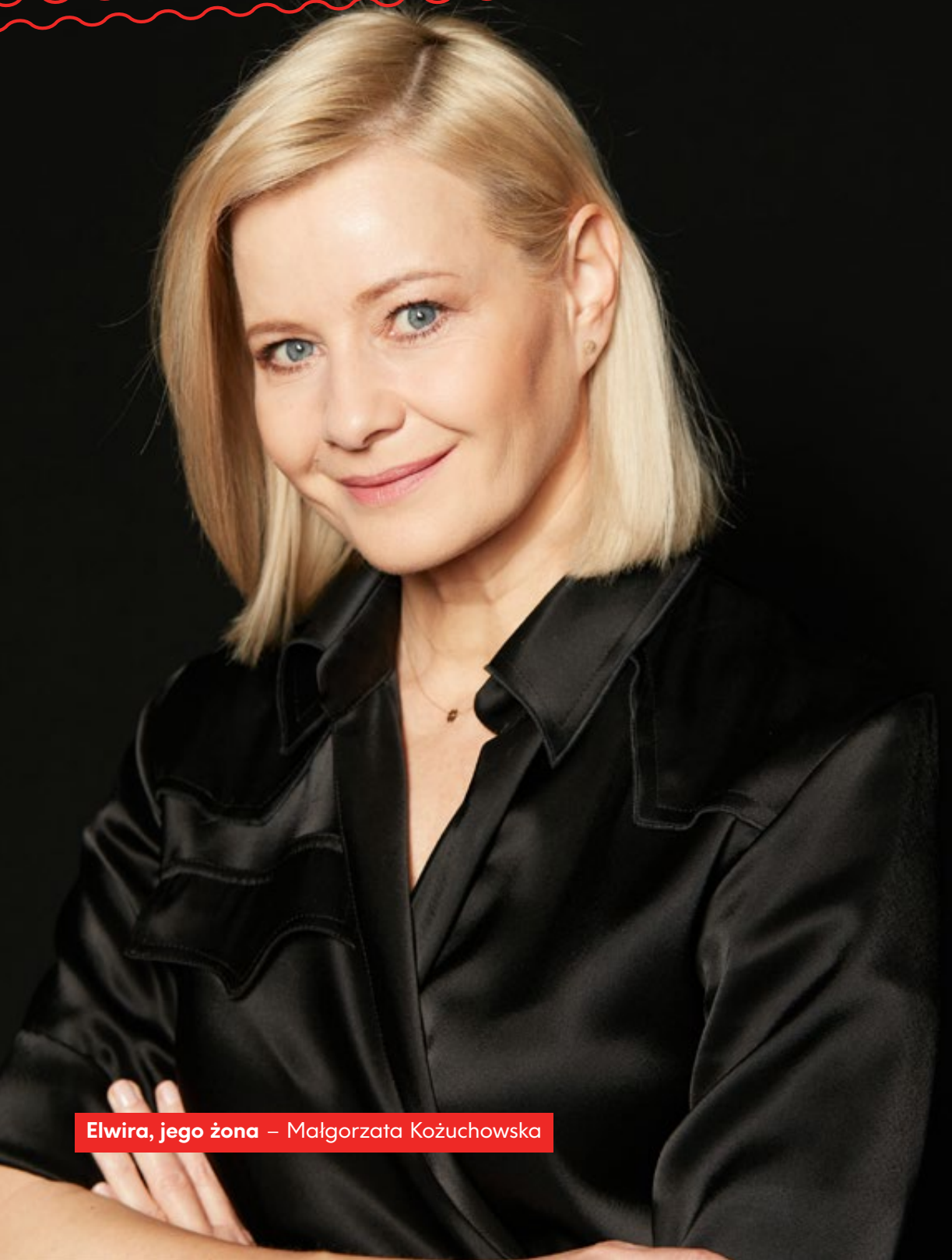
Elwira, jego żona – Małgorzata Kożuchowska