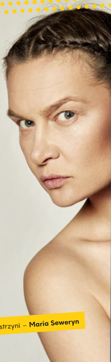
Maria, ochmistrzyńi – Maria Seweryn