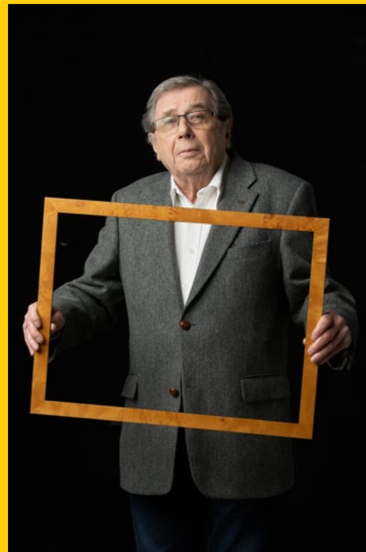
Janusz Gajos podczas sesji plakatowej