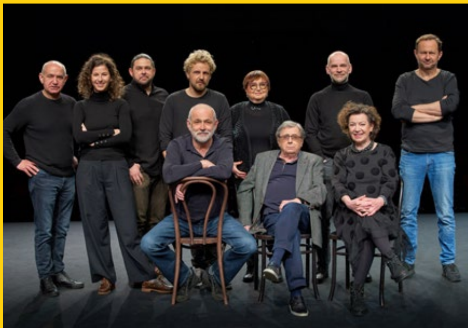
Janusz Gajos oraz zespół aktorski