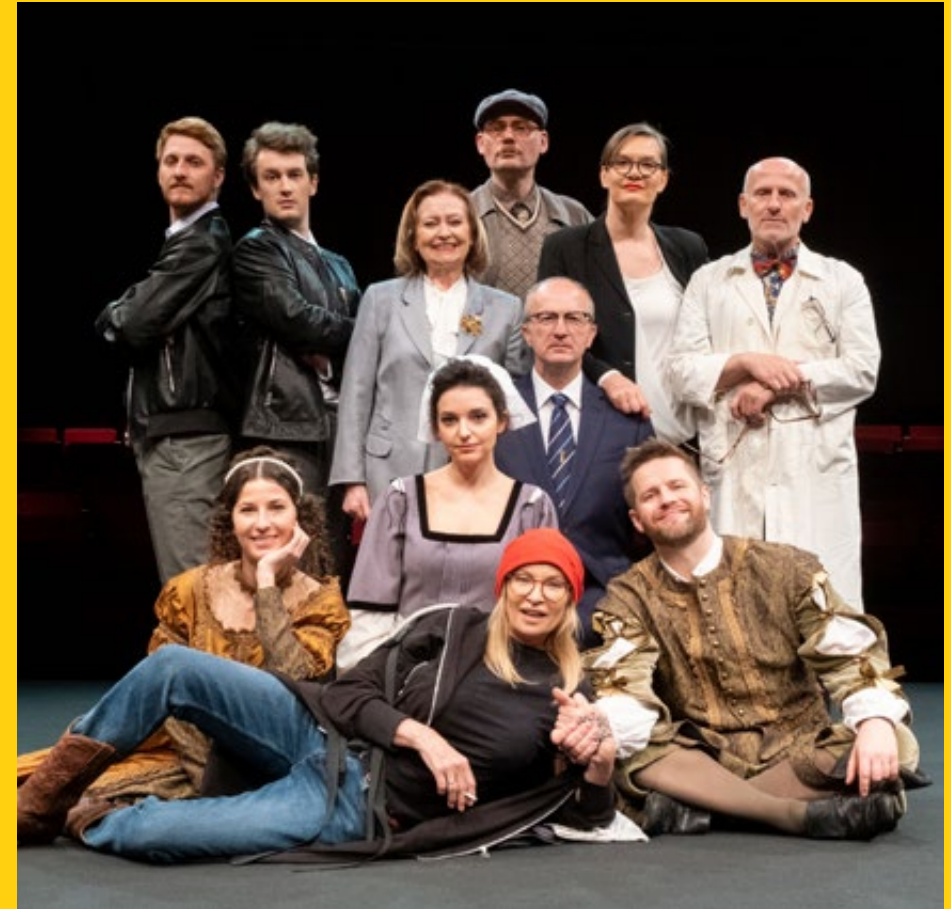
Fotografia z sesji plakatowej