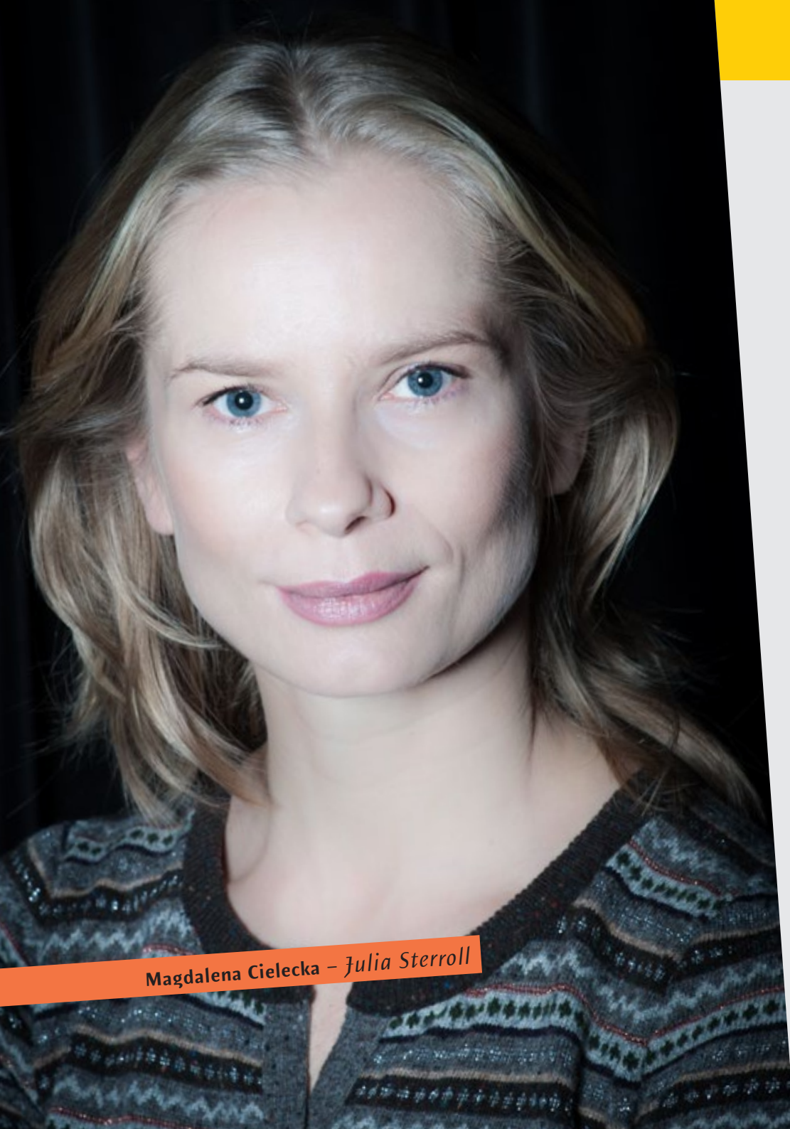
Magdalena Cielecka – Julia Sterroll