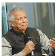
Dr Muhammad Yunus