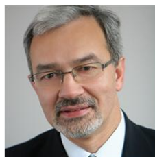
Dr Jerzy Kwieciński