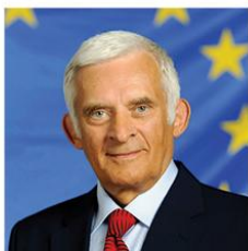
Prof. Jerzy Buzek